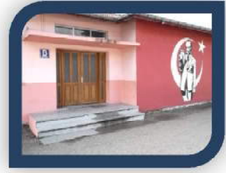
Sultaniye İlk ve Orta Okulu Fiziki Altyapısı