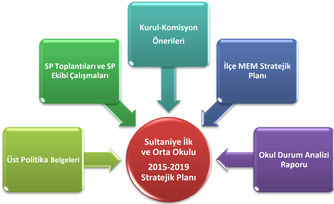
Şekil 1: Stratejik Plan (SP) Oluşum Şeması