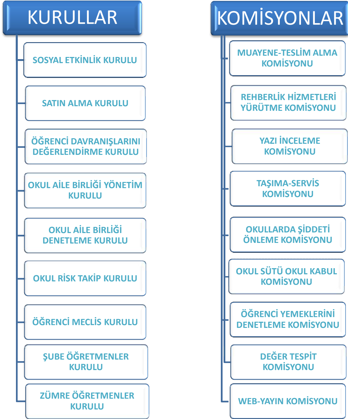
Şekil 3 : Kurullar ve Komisyonlar

Okulumuzda faaliyet gösteren kurul ve komisyonlar aşağıdaki grafikte gösterilmiştir.