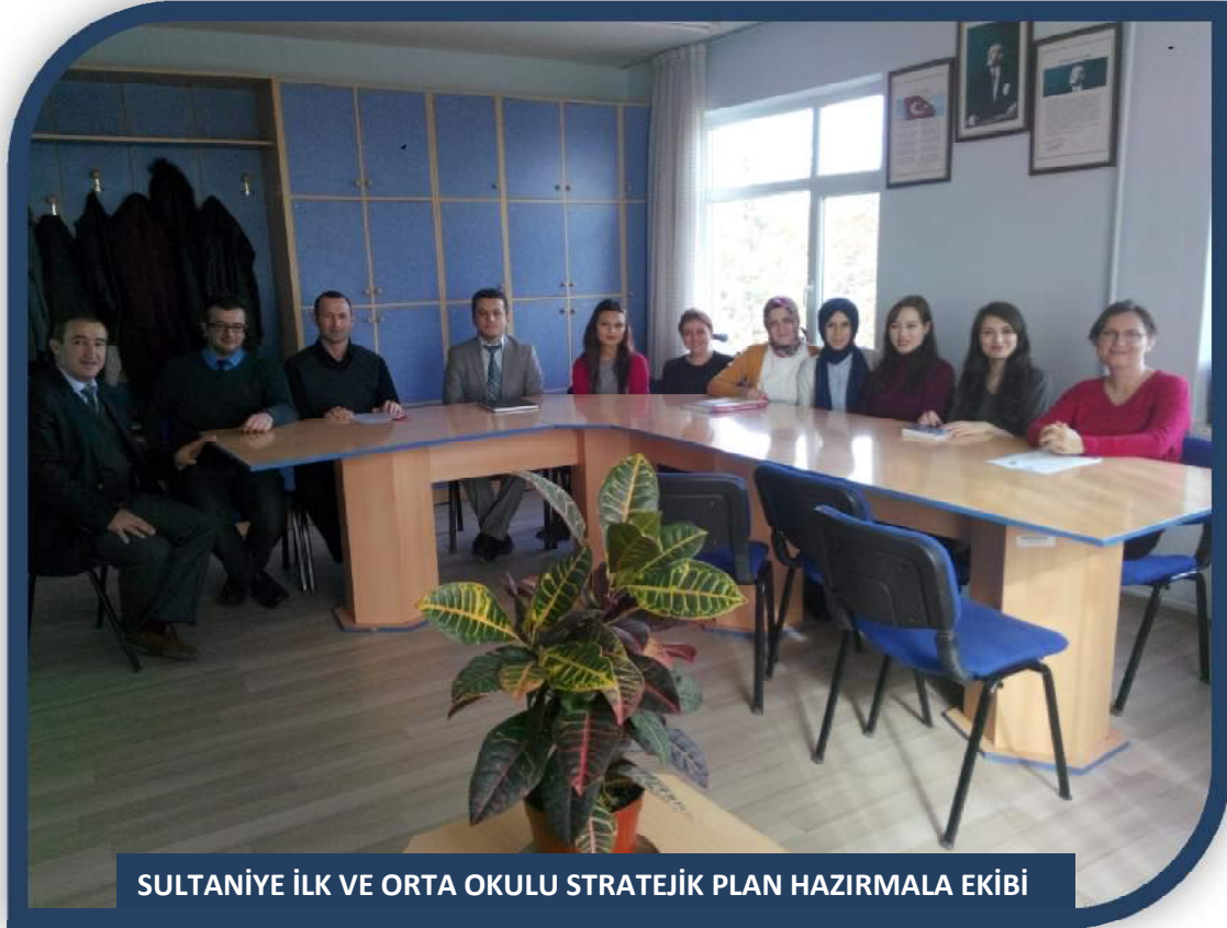
Resim 1 : Sultaniye İlk ve Orta Okulu Stratejik Plan Hazırlama Ekibi