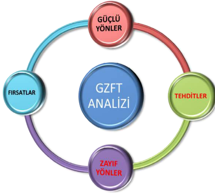
Şekil 4 : GZFT Analizi

Stratejik planlamanın en önemli unsurlarından biri GZFT analizidir. GZFT analizi, kuruluşun kendisinin ve kuruluşu etkileyen koşulların sistemli olarak incelenmesidir. GZ kuruluş içi analiz kısmını, FT ise çevre analizi kısımlarını oluşturur. GZFT analizinde iç paydaşların görüşlerine ağırlık verecek ve kurum içi katılımı en üst seviyede sağlayacak bir yöntem kullanılmıştır. Her birim için ayrı ayrı yapılan çalıştaylar ve atölye çalışmalarında çalışanların kendi birimlerine yönelik güçlü ve zayıf yanları fırsat ve tehditleri sıralamaları ve önceliklendirmeleri sağlanmıştır. Birim bazında oluşturulan GZFT listeleri Stratejik Plan Ekibi tarafından gözden geçirilerek kurumsal GZFT analizi yapılmıştır. GZFT analizinden elde edilen veriler, 'Geleceğe Yönelim' bölümündeki amaç ve hedeflerin oluşmasına katkı sağlamıştır.